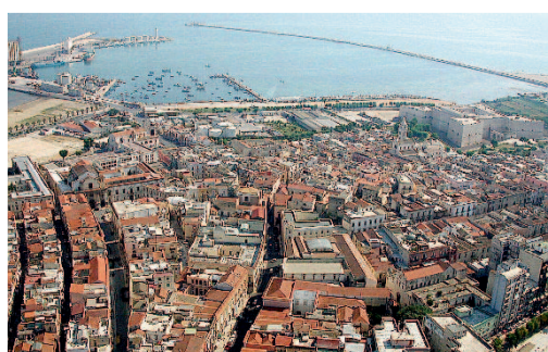
BARLETTA Una panoramica aerea della città